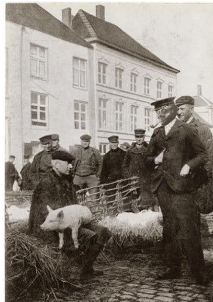
Op de vèrrekesmart (Kesteelplein meej 't 'uis Justinus van Nassau)