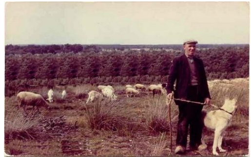
D'èrder meej z'n kudde op de Galderse 'ei