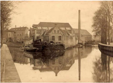
Mach.Fabr.De Bruyn Kops & Backer

Op diejene maondag, z'adde d'r nie aon gedacht daddet karrenevalsmaondag was, liepe Kiske en Mieske al klasjeneerend en genietend van mekaore, de Grôte Mart op richting botter'al. Gelijkzeitig kwamt 'r ôk 'ne karrenevalsstoet de Mart oplôôpe. Vroeger, in de tijd dat Breda tijes de karnaval nog Abdera wèr genoemd, beston dun'optocht alleenig uit un stelletje as zotte en narre verkleede Bredaonaojers die zich 'eele daoge tegoed deeje aon 't gerstenat uit de veule brouwerijkes die ons stad toen nog kènde. Deez karrenevalsvierders, die ammaol "Kiske de Prins" kende, dreeve ôk nouw wir de spot mee'j'um en mee'j z'n lief mèske Mieske. Omda Kiske 'ne gève mâânskèrel was trok'ie zich niks aon van de spotternij èn liep gewôôn deur, mee'j de stoet pèstende karrenevalsvierders achter 'm aon. Mieske die niks moes 'ebbe van al da gedoe vroeg aon Kiske om zich rustig t'ouwe èn zich nie mee'j die karrenevalsgekke te bemoeie. Maor Kiske was ut daor nie mee'j'êêns; 'ij was immers 'de Prins' en nie diejene zot die as Prins vekleed èn mee'j twee schoon meskes in d'n optocht mee'jliep.