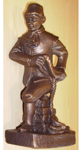
Adriaan van Bergen

Turrefschipper Adriaan van Bergen (ca. 1550 - ca. 1622) vaort in opdracht van Charles De Héraugière, 'ne kaptein in dienst van 't leger van prins Maurits, meej zôn 70 manschappe, vestopt onder de turref, de kusteelgracht binne deur de sluis bij 't Kraojebos, benoorde 't kusteel. De bevèl'èbbende korreperaol onderzoekt 't schip, mar vin niks vedachts. Èn omdatter meej de vastenaovend veul van z'n manne in de kaffeejkes in de stad durrun dorst zitte te lèsse wordt 'r nie mir naor 't schip omgekeeke. Nao 't opkôme van de maon, om twaoluf ure snachs, klimme de manschappe die in 't ruim vestopt zaote, uit 't schip èn veroovere 't kusteel van Bredao. Teegestâand 'èbbe ze bekâanst nie g'ad omdatter veul van d'ieteljaonse soldaote, die saomespande meej de Spanjaorde, zo as gezeejd, karreneval aon 't viere waore. Op deez manier valle de stad èn 't lâand rond Bredao in d'ânde van prins Maurits.